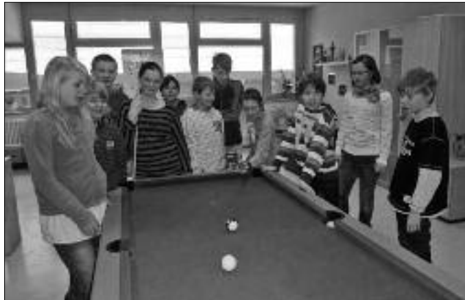
Marion Rothe Mittelschule Flöha-Plaue

den Reiterhof Falkenau gehörten ebenso dazu wie der Besuch im Kuddeldaddeldu, einem riesigen Platz zum Toben und Spielen, in Chemnitz. Auch das leibliche Wohl kam natürlich nicht zu kurz. So konnte man z. B. fleißigen Pizabäckern in der Hauswirtschaftsküche über die Schultertern schauen. Am Ende der Woche stand für die Teilnehmer fest, dass sie auch bei den 14-tägigen Ferienspielen im Sommer auf alle Fälle dabei sind!